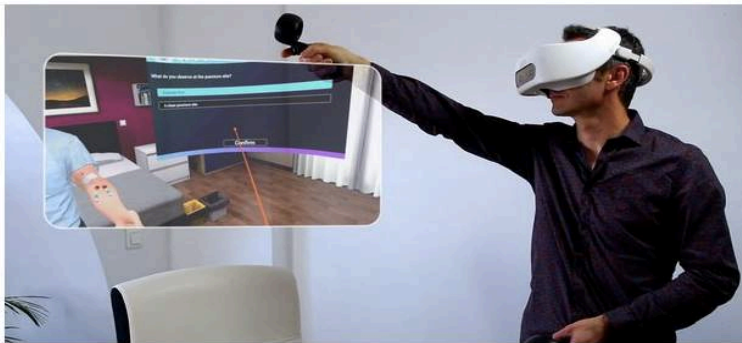
Les formations développées avec le concours de Simforhealth permettent de former le personnel médical. Ici, avec le dernier casque de réalité virtuelle autonome HTC Vive Focus Plus